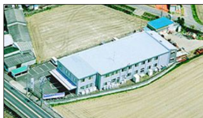
写真上：スター電機株式会社 全景 写真右：自らの経験をもとに熱く語る 森永さん

ご本人曰く、経営はP/LよりB/S重視の経営を目指し、分社化や合併など、試行錯誤の年月を費やされたそうです。(25期 山田 茂樹)