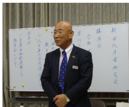
自らの生い立ちも含め熱のこもったお話でした

短い時間ながら、自らの商売の原点、生きざまにもお話はおよび、非常に感動深い講演をしていただきました。