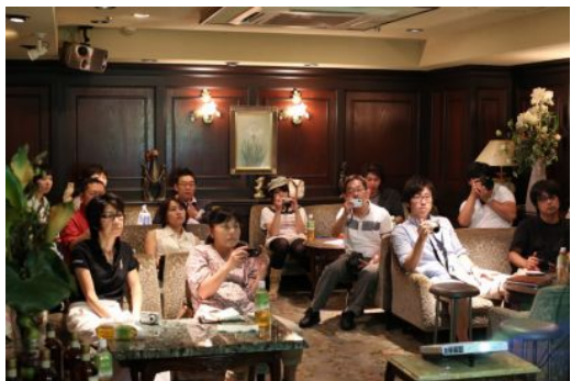
< ↑ 真剣に座学に取り組む参加者の皆さん >