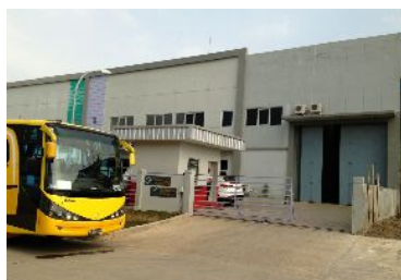
インドネシア工場