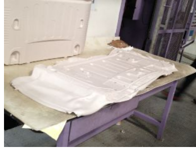
ホカホカの出来立て