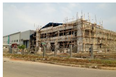
建築中の工場(倍以上の広さに)