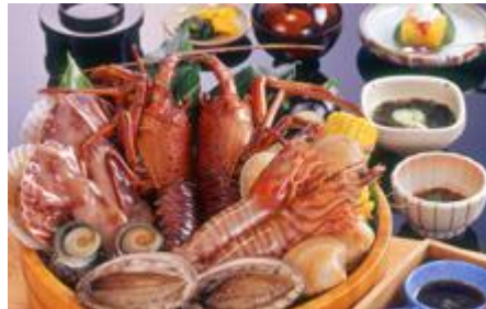
鳥羽の宿場町 吉田屋 鳥羽のてっぱり料理