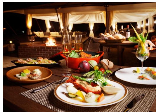
N E M U RESORT